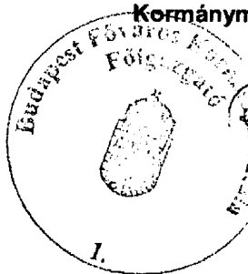
Palich Etelka főigazgató